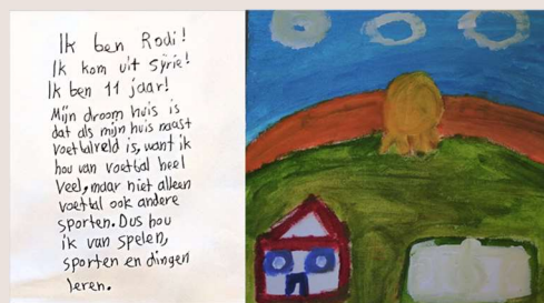
Foto: Project in Wierdenland rondom Droomhuizen in samenwerking met AZC Delfzijl

We kunnen er niet omheen. Dagelijks is het aanmeldcentrum van het COA in Ter Apel in het nieuws, en niet op een mooie manier. Het museum kan iets met dit thema doen. Bijvoorbeeld een tentoonstelling met kunstwerken van kinderen uit het centrum gelijktijdig met scholen in Ter Apel, in samenwerking met een professionele kunstenaar. Een breed thema zoals 'droomhuis' of 'lievelingseten' kan een goede aansluiting zijn op thema's in het museum. Alle kinderen denken immers na over wonen of je lievelingseten. Zo leer je de ander kennen.